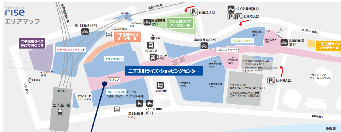
ニ子玉川ライズ ガレリア