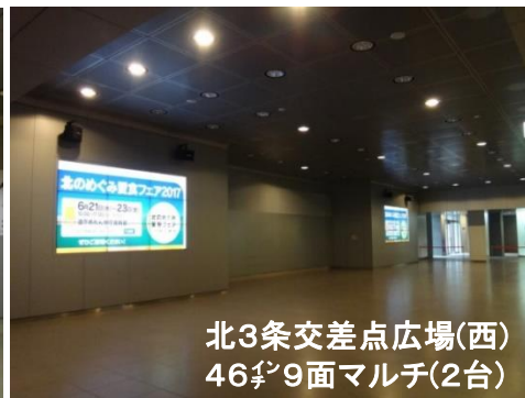
北3条交差点広場(西) 46 ㍉ 9面マルチ(2台)