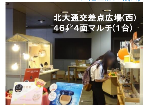
北大通交差点広場(西) 46 ㍉ 4面マルチ(1台)