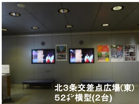
北3条交差点広場(東) 52 ㍉ 横型(2台)