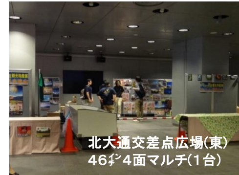
北大通交差点広場(東) 46 ㍉ 4面マルチ(1台)