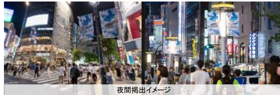
夜間掲出イメージ