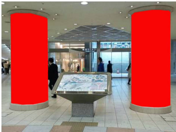
○ Aパターン 柱2本【梅田DTタワー前】