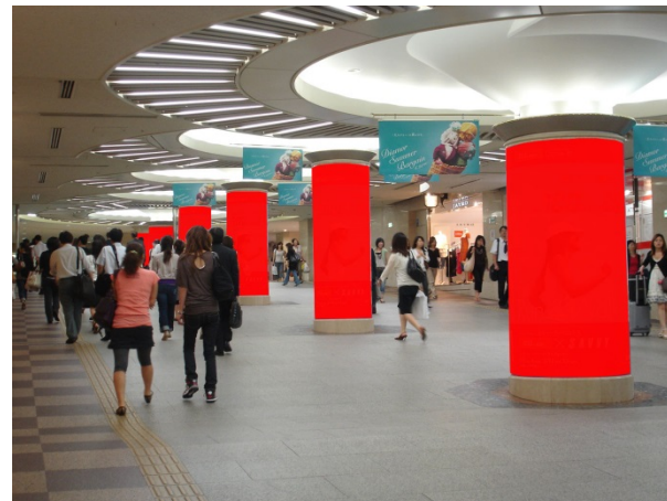
○ Cパターン 柱6本【JR大阪駅側】