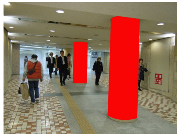
○ Eパターン 柱2本【東梅田駅側】