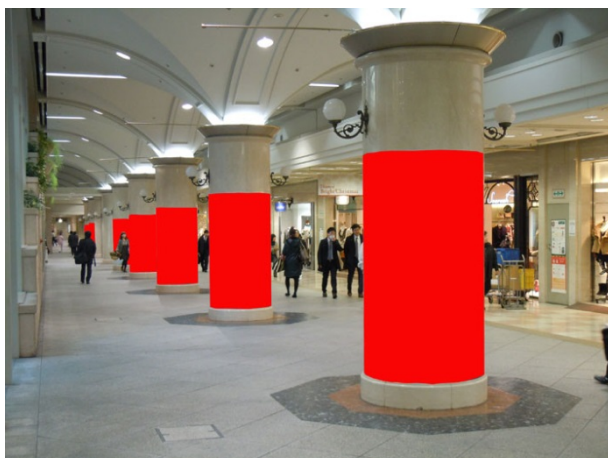
○ Dパターン 柱7本【JR北新地駅側】