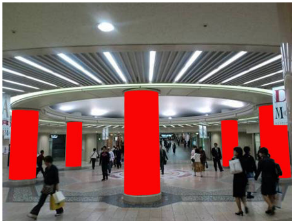
○ Bパターン 柱6本【円形広場】