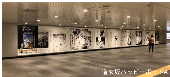
道玄坂ハッピーボードA