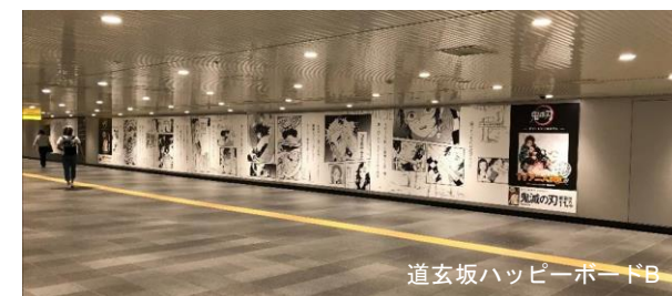
道玄坂ハッピーボードB