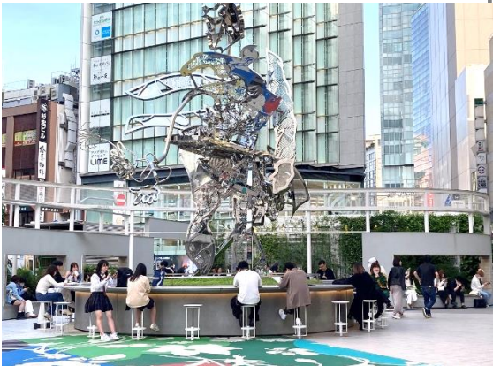
「新宿東口駅前広場」 ルミネと東日本旅客鉄道が2020年に共同でオープンした、待ち合わせや休憩に利用されているコミュニティスペース