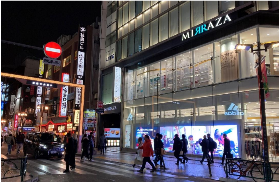
「AINZ&TULPE新宿東口ビジョン」