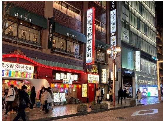
「新宿龍乃都飲食街」 2022年10月オープンの都内最大級全17店舗、24時間営業のエンタメ系飲食街