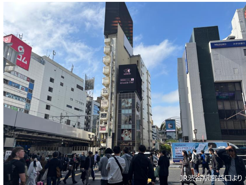
JR渋谷駅宮益口より