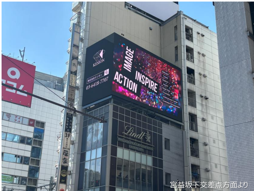
宮益坂下交差点方面より