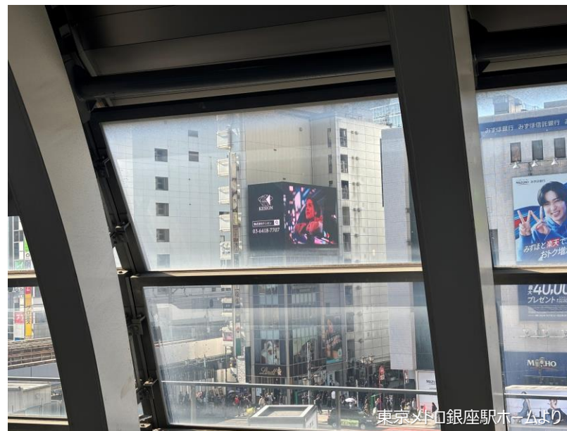
東京メトロ銀座駅ホームより