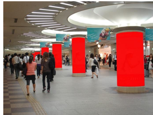
○ Cパターン 柱6本【JR大阪駅側】