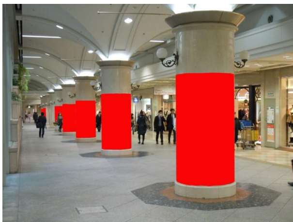
○ Dパターン 柱7本【JR北新地駅側】