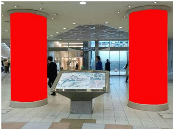
○ Aパターン 柱2本【梅田DTタワー前】