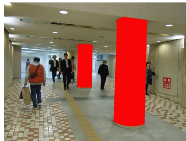
○ Eパターン 柱2本【東梅田駅側】